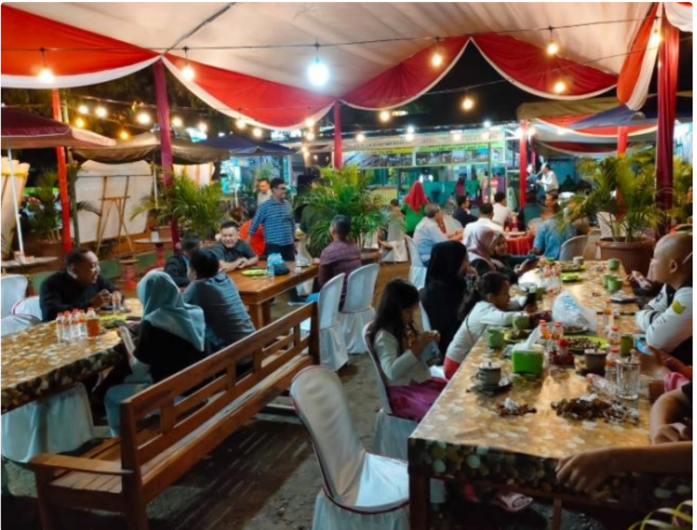
RM Sribu Asri Buka Cabang ke 3 di Jl Raung 190 Kediri, Pelanggan: The Best Lesehan kediri Jawa Timur

KEDIRI- Rumah Makan Sribu Asri kembali membuka cabang baru yang ke tiga di Ec RSI Bandar Melati Jl. Raung 190 Kediri, Jawa Timur.